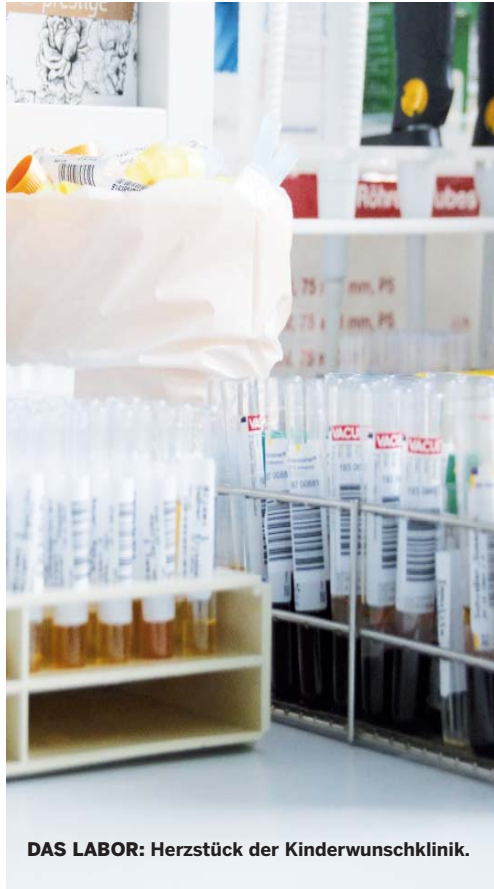
DAS LABOR: Herzstück der Kinderwunschklinik.

Es wird individuell für jedes Paar entschieden, welche Therapie die richtige ist. Hierfür verfügt das Zentrum außerdem noch über viele weitere Untersuchungs- und Laborräume und einen eigenen OP-Bereich. Alle nötigen Eingriffe und Untersuchungen können so direkt vor Ort durchgeführt werden – das ist praktisch und beruhigend. Dr. Pauer zeigt uns den reproduktionsmedizinischen Laborbereich sowie den Embryonentransferbereich. Auch hier hängt wie im Behandlungszimmer ein moderner Bildschirm an der Wand. Wenn eine Samenprobe nötig ist, gibt es hierfür ebenfalls einen Rückzugsraum für den Mann. „Die meisten machen das aber lieber zu Hause und bringen das Sperma dann zu uns“, erzählt Dr. Pauer. Auch wenn die Stimmung im Zentrum locker ist, ist das für einige Männer wohl doch ein wenig zu viel Druck.